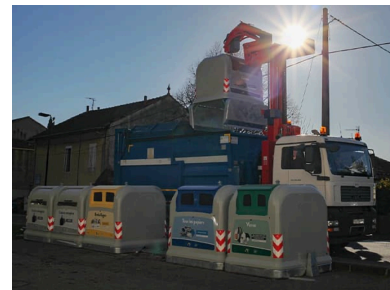
Imagen de referencia pública de Nord Engineering incluida en la v1 del sitio NordAr.